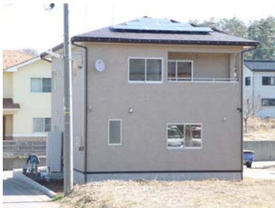
I 宅 パナソニック 4.2kw