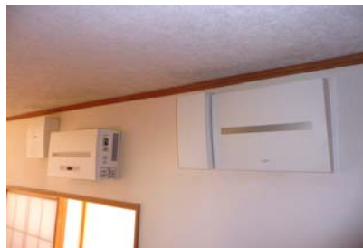
接続箱、パワーコンディショナー、分電盤