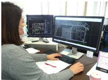
CADソフト操作中(弊社設計室)