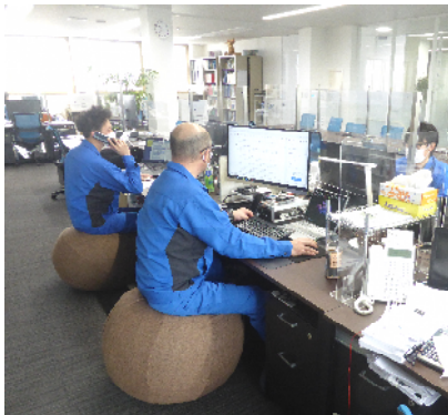
バランスボールで腰痛解消