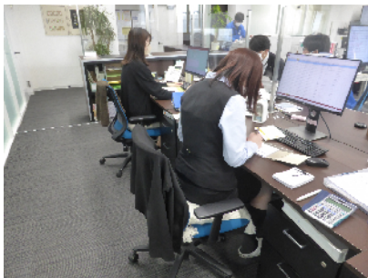
バランスクッションは違和感がありません