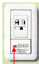
入、切 表示で分かりやすい