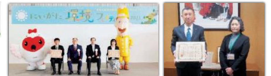
山津冷蔵食品株式会社