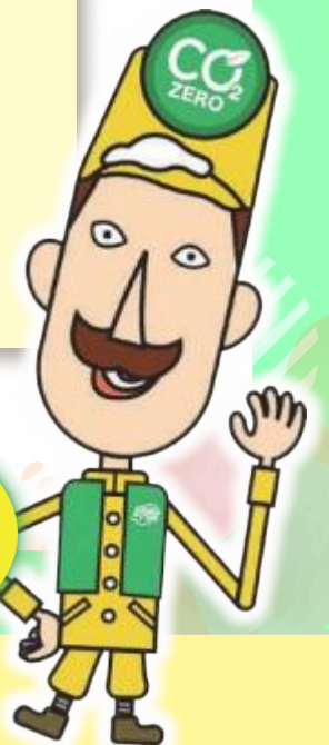
グリーンレルヒさん®